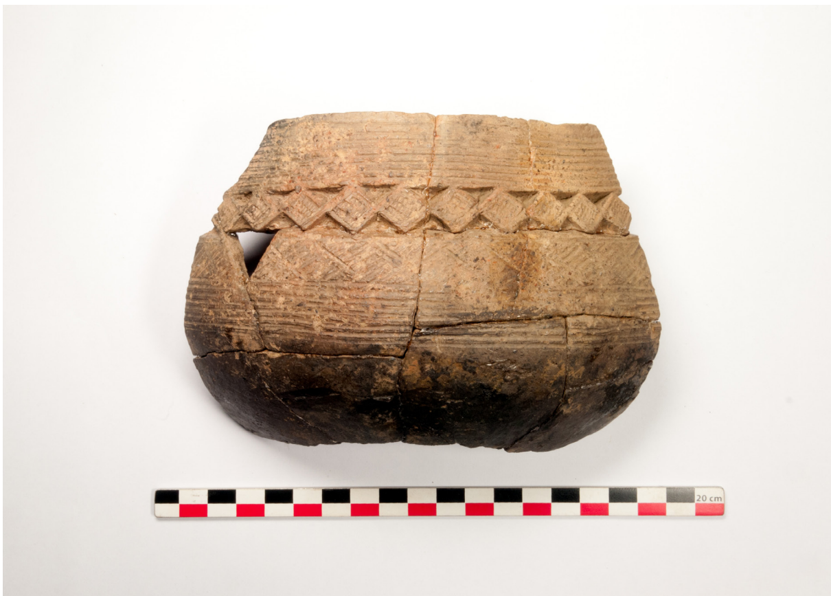
Figure 5: Pot du Groupe II, Makuti.

La céramique de surface peut être regroupée en deux types. Un premier où le décor se limite à une bande au niveau de l'épaule (Figure 4) et un second qui comporte un décor couvrant sur le haut de la panse, fait de multiples traits disposés en triangle et de chevrons (Figure 5). Ce type se retrouve également en stratigraphie et présente de grandes affinités stylistiques avec la céramique du « groupe II » ou « groupe Mbafu » qui a été découverte dans une série d'autres sites à travers le Bas-Congo en RDC (Clist 1982, 1991, 2012; de Maret 1972, 1982), et notamment à une dizaine