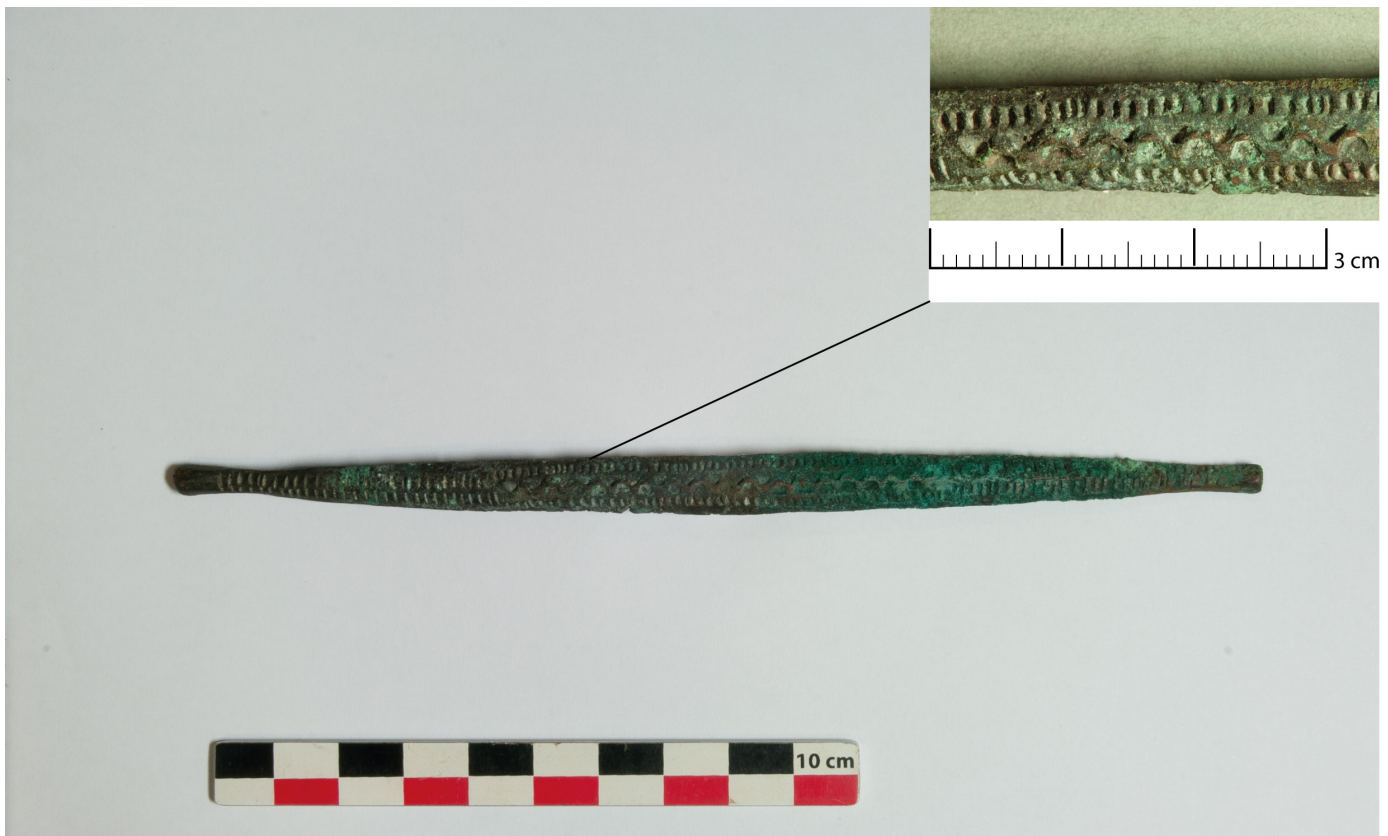
Figure 3: Ngele en cuivre. Makuti, République du Congo.