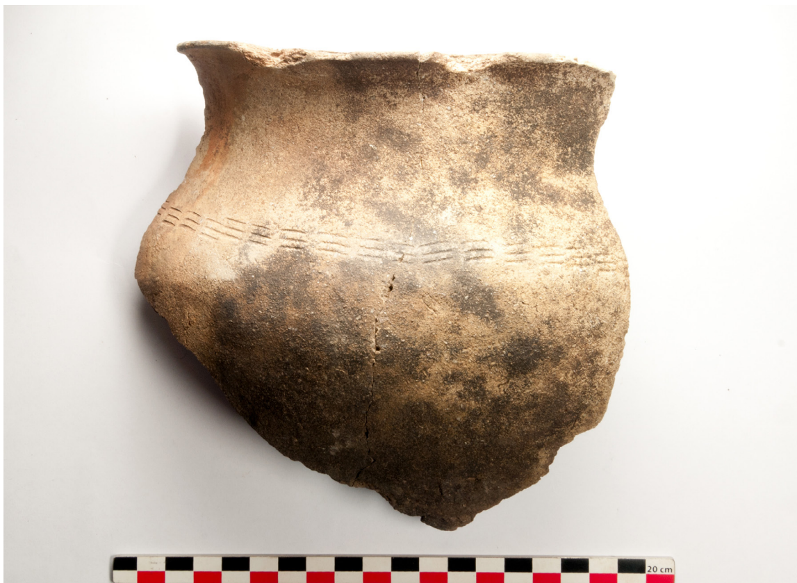
Figure 4: Céramique de surface, Makuti.