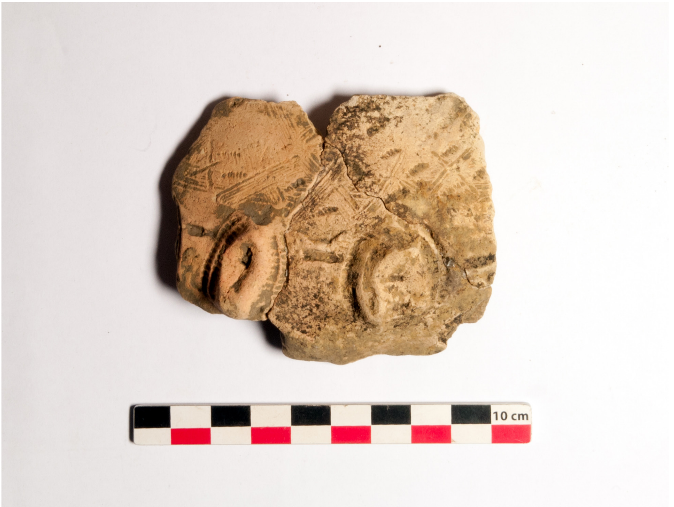
Figure 6: Céramique découverte à Nkabi.

Une butte de terre très foncée, sans doute également liée à du rejet métallurgique a aussi fait l'objet d'une coupe et présentait le même type de céramique.