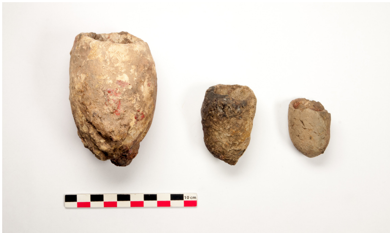
Figure 8: Creusets en terre cuite découverts à Mindoundou.

Les résultats de cette mission sont prometteurs. Les prospections et les sondages confirment la présence importante de vestiges de métallurgie du cuivre dans la région de Mindouli. Leur étude va permettre d’y associer des groupes céramiques de différentes époques dont certains reflètent les circuits commerciaux qui reliaient cette zone de gisement de cuivre à d’autres régions. Un premier examen de ces groupes montre déjà une certaine homogénéité et la suite de leur analyse devrait permettre d’élaborer une première séquence céramique pour cette région de la République du Congo. Il sera alors possible de la relier avec ce qui