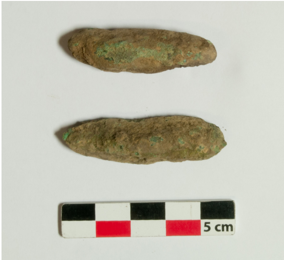
Figure 7: Lingot de cuivre. Nkabi, République du Congo.